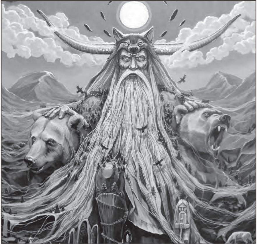
Древнеславянский бог Велес

Знахари и ведуны заговаривали и зачитывали в этот день детей на прилежное учение. С этого же дня начинали обучать ведуны и знахари своему «знатью» да «веданию» – учить наукам тайным!