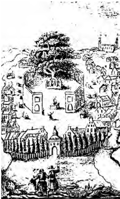
Языческие святилища в городе Ромов