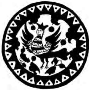
Солнышко вешнее в росписи прялки. Русский Север. 19 век

Нам зима-то надоела, Хлеб и соль у нас поела, Руки-ноги позновила, Скотинушку поморила, И солону подобрала, И мякину подмела!