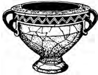
Гадательный сосуд-календарь из Лепесовки 4 век (Украина)