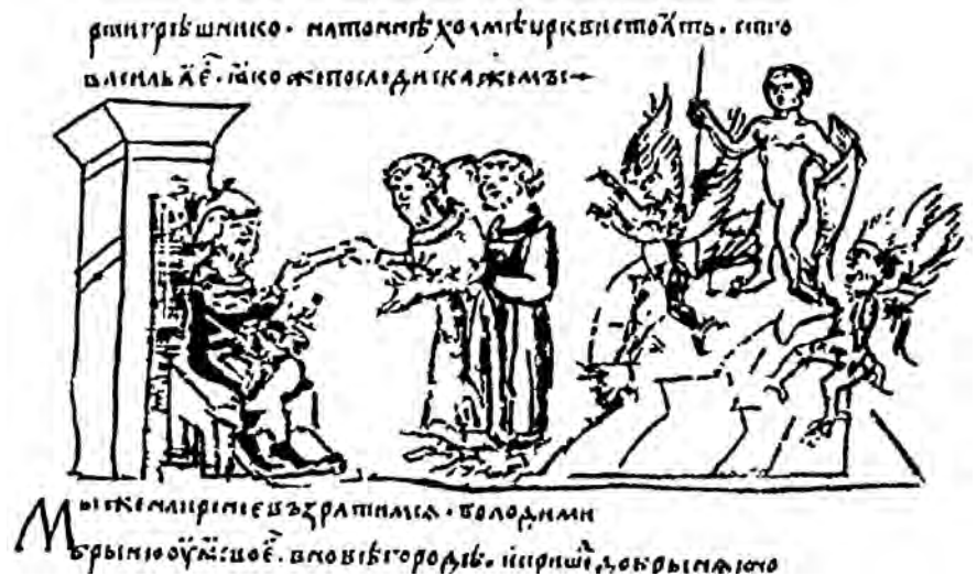
Святилище на Благовещенской горе во Вщике

В отношении западных славян хорошо известно, что их храмы служили не только духовным целям, но и целям астрономии.