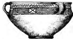
Сосуд-календарь из Каменки на Днепре. Черняховская культура 2–4 в