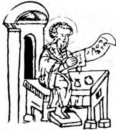
Летописец. Миниатура из Радзивилловской летописи, 13 век