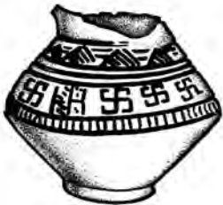
Сосуд-календарь из Смелы. Скифское время

личилась на 3 дня – солнцестояния стали приходиться на 12 июня и 12 декабря, о чем народ знал. Об этом говорит своеобразный обряд, совершавшийся в XVI веке в Московском Кремле. И он явно является рудиментом более древних сакральных обрядов дохристианской Руси. В день Спиридона перед царем отчитывался звонарный староста кремлевского собора как блюститель часобития (звона часов), бил челом и докладывал, что «отसेле возврат солнцу с зимы на лето, день прибывает, а ночь умяется». За эту радостную весть царь жаловал старосту деньгами – выдавалось 24 рубля серебром. На летний солнцеворот (12 июня) тот же докладчик приносил весть: «отसेле возврат солнцу с лета на зиму, день умяется, а ночь прибывает». За эту прискорбную весть его запирали в темную палатку на ивановской колокольне не менее чем на 24 часа.