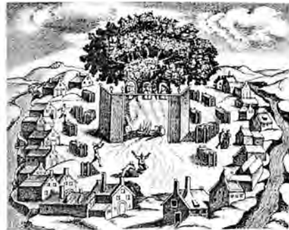
Одно из западно-славянских (прусское) святилищ, по образцу коих строились новгородские