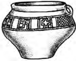
Сосуд-календарь из Балтийского Поморья