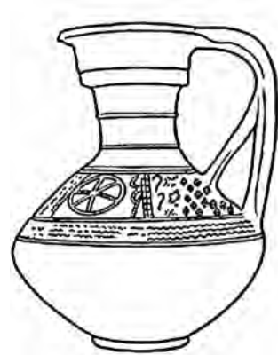
Ритуальный сосуд-календарь 4 века (Киевщина)