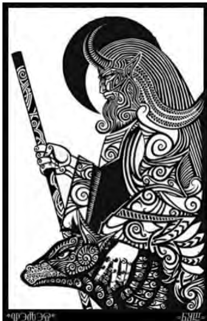
Рогатый бог Велес

Велес (Волос) — «скотий бог», в славянской мифологии божество, покровитель скота, а также покровитель сказителей и поэзии. Велес был тем, кто породнил людей и животных, учил людей не убивать животных, а использовать их в хозяйстве. Он являлся покровителем волхвов, пастухов и торговцев. И, как считалось, наделял человека талантом и физическими данными, хорошим голосом и слухом.