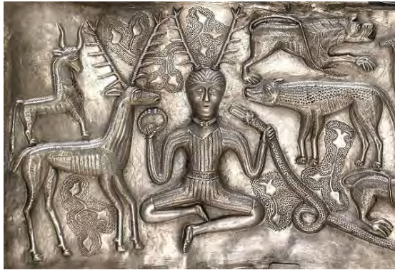
Древнее изображение Рогатого бога на котле, найденном в Дании ( http://historic.ru/news/item/f00/s31/n0003116/index.shtml )

Маргарет Мюррей в своей популярной работе об истории ведовства в Европе «Культ ведьм в Западной Европе» (1921) отстаивает идею о том, что изображение Дьявола и сатанинских шабашей, на которые собирались якобы ведьмы, являются искажёнными отражениями действительно существовавшего с предысторических времён на территории Европы языческого культа. Преследовавшихся же инквизицией в средневековье ведьм и колдунов М. Мюррей рассматривала как последних последователей этой древнейшей религии. Иначе говоря, они видели в Дьяволе ипостась древнего Рогатого бога.