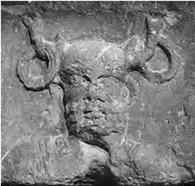
Древнее изображение Рогатого бога Кернунна

В своей книге М. Мюррей упоминает и о кельтском боге Кернунне, изображение которого в шапке с рогами, якобы напоминавшей шаманскую, обнаружено на части рельефа древнего алтаря под собором Парижской Богоматери. Позднее он трансформировался в фольклорный образ Херна-Охотника (далее Кернунна).