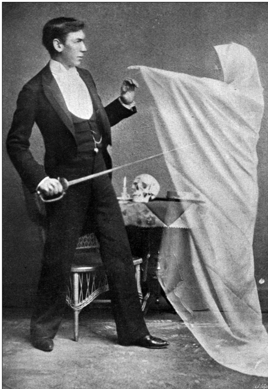
Рис. 1. Фотография духа