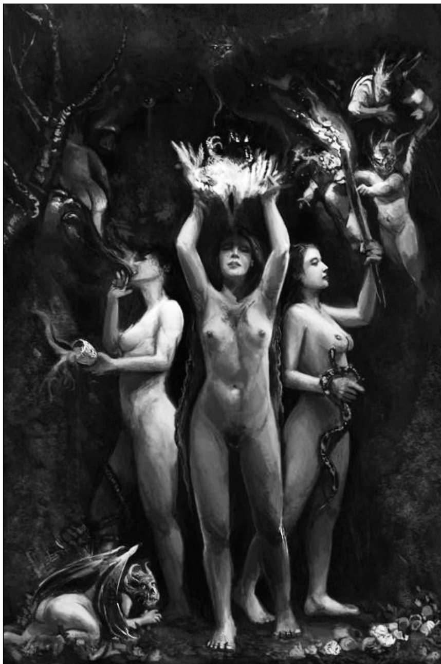
Геката. Рисунок Митчелл Нолти