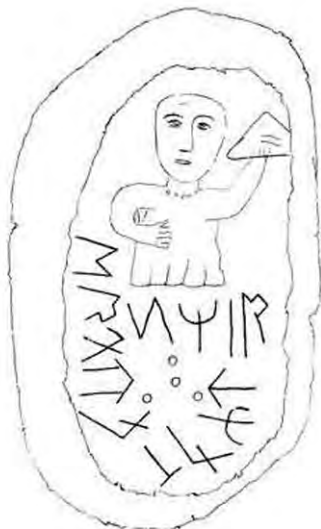
Микоржинский первый камень