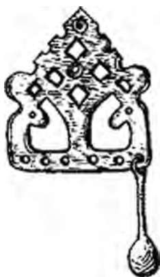
Подвеска-амулетс обозначением символа Земли и небесными оленями.

Поклонялись славяне Роду – Отцу Вездесущему, Сварогу – его сыну, который считался даже ипостасью бога Рода. Сварог научил людей кузнечному делу, работать с металлами, плавить руду. А также Сварог был богом законов. Например, он повелел мужчинам иметь и знать одну жену (женщинам аналогично – одного мужа), детей воспитывать в уважении к старикам и обычаям. Также у наших предков очень почитаемы были такие Боги как Перун, Святовит, Мара, Макошь, Ярила, Лада, Леля, Жива.