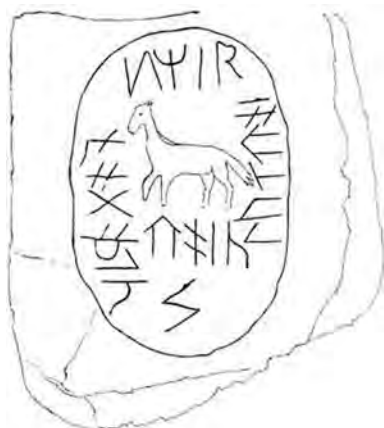
Микоржинский второй камень