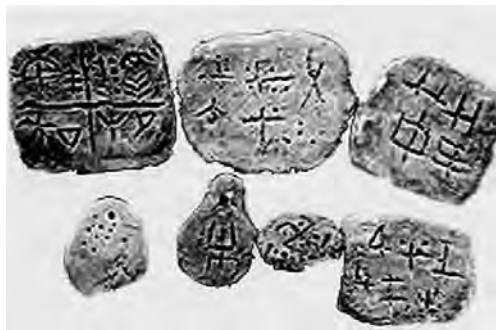
Микоржинские камни, найденные в Польше, в Познанском районе в 1771г.

Славянские руны имеют сходство с северо-италийским (альпийским алфавитом), возможно из-за смешения племён древних славян с северными этрусками.