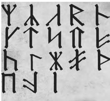
Северо – венедский рунический строй.

Славянские рунические знаки использовались волхвами для гадания, предсказаний и колдовства. В наше время известен северо – венедский рунический строй из 18-ти рун, на основе которого я создала гадальную колоду Славянских рун.