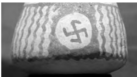
Керамический сосуд, найденный в Акмолинской обл.

Очень сильной магической силой, по мнению древних славян, обладали солярные и свастические символы. Свастическая символика изображалась на посуде, одежде, топорах, стрелах наших предков. Она была дана им Богами и связана с Солнцем. Считалось, что солярные знаки несут в себе защиту и покровительство Высших Богов, удачу, победу.