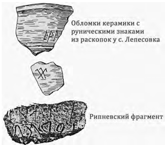
Обломки керамики с руническими знаками из раскопок у с. Лепесовка