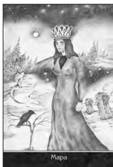
Карта №1 . МАРА