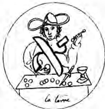
Рисунок Элифаса Леви на тему аркана «Маг» из его книги «Ключи и ключики Соломона»

Годы жизни – 8 февраля 1810 г. – 31 мая 1875 г. Элифас Леви – французский окультист и таролог . Он не создал своей авторской колоды карт Таро, но оказал фундаментальное влияние на трактовку и изучение символики системы Таро. Сохранилось несколько рисунков Элифаса Леви на тему символика карт Таро. Элифас Леви трактовал карты Таро на основе вариантов Марсельской системы. Он первым соединил 22 карты Таро и карты еврейского алфавита. Еврейскую букву Алеф «א» он связал с картой Маг марсельского Таро. Буква א силуэтно напомнила Элифасу Леви расположение рук персонажа Маг в марсельском Таро.