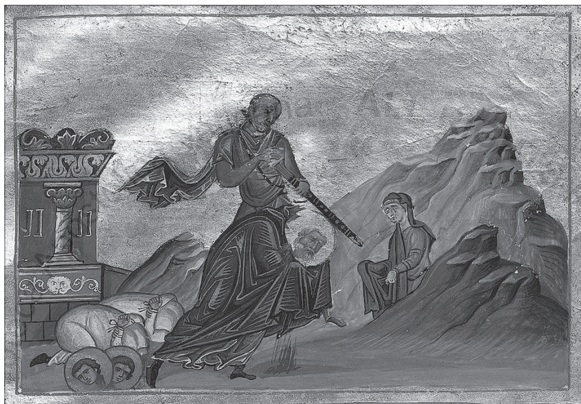
Мученичество святых Дионисия Ареопагита, пресвитера Рустика и диакона Елевферия. Миниатюра из Минология Василия II

совещании высказался за сохранение Иерусалимского храма, и его поддержал еврей по роду и племени Тиберий Юлий Александр; тогда как фрагмент Тацита, сохранившийся в хронике Сульпиция Севера, сообщает об обратном: Тит настаивал на разрушении храмового комплекса Святого Града, чему вторил и Тиберий Юлий Александр. Здесь, как выясняется, перед нами возникает древняя проблема гения и злодейства (которой зачастую сопутствовал и адюльтер или покушение на него), в иудейской традиции сопряженная с кровными узами: Давид – Авессалом, Филон – Тиберий Юлий Александр; она великолепно отображена в «маленькой трагедии» А.С. Пушкина «Моцарт и Сальери». Считается, что описанная Иосифом Флавием Иудейская война была первым холокостом в истории еврейского народа, потерявшего тогда около 500 000 своих сыновей и дочерей. После катастрофы 70-х гг. новой эры Тиберий Юлий Александр продолжал пребывать на