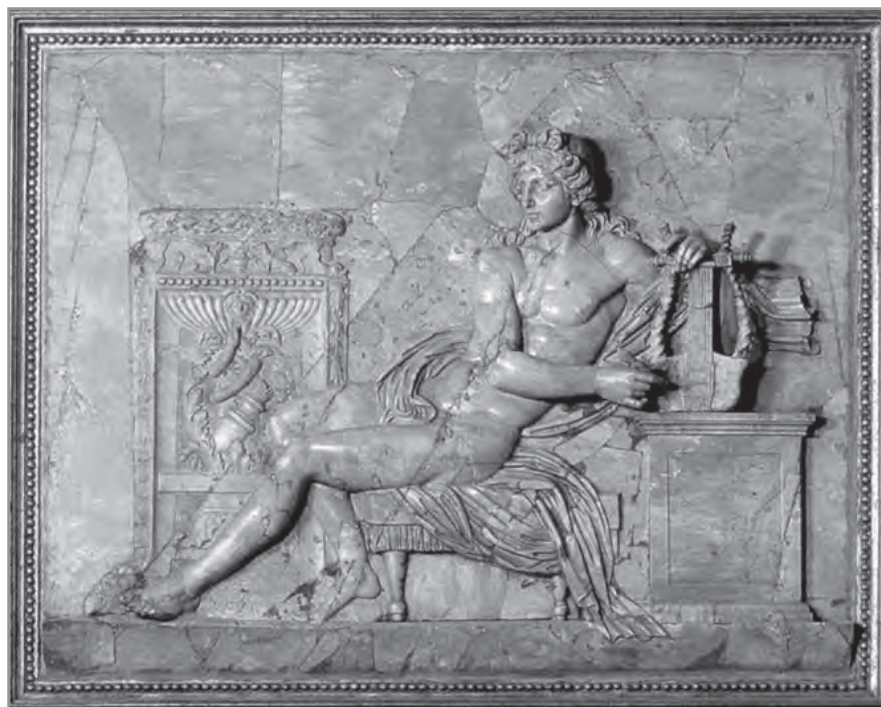
Винченцо Пачетти. Аполлон, 1783 год

Кроме того, герметические тексты, вдохновлявшиеся этой доктриной, не являются собственно мистическими; они не ведут к экстазу, полному слиянию человеческого существа с Богом. Если они допускают, как и всякая религиозная эллинистическая мысль, божественное происхождение души, то они не делают из нее родственницу, спутницу светил. Именно в другом дуалистическом течении говорилось об обожении, вхождении в Бога: здесь же зачастую ограничиваются развитием темы познания Бога посредством наблюдения мироздания; религиозный человек созерцает вселенную, он поражен ей, и это восхищение его переносит на познание Творца в его почитании.