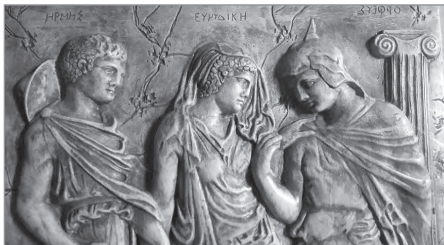
Орфей, Эвридика и Гермес. Рисунок с античного барельефа на Вилле Альбани в Риме