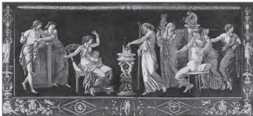
Жан-Жак Лагрене. Античное жертвоприношение

Ф илософические сочинения Трисмегиста материально разделяются на три группы: Corpus Hermeticum (CH), «Совершенное Рассуждение» (λόγος τέλειος), из которого существует под названием Asclepius ( Ascl. ) только латинский перевод, приписываемый по недоразумению Апулею, наконец, многочисленные и важные выдержки, рассеянные в Anthologion Стобея и которые я здесь называю для вящей лаконичности Stobaei Hermetica ( St. H. ).