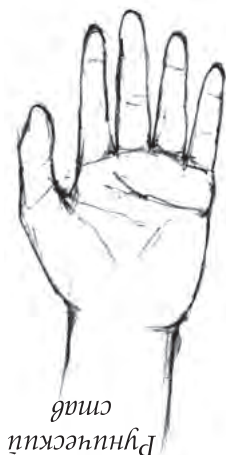
Рисунок №2 – Рунический став на запястье

Если Ваша рука опущена вниз, став сохраняет прямое, рабочее положение. Иначе получите откат и проблемы.