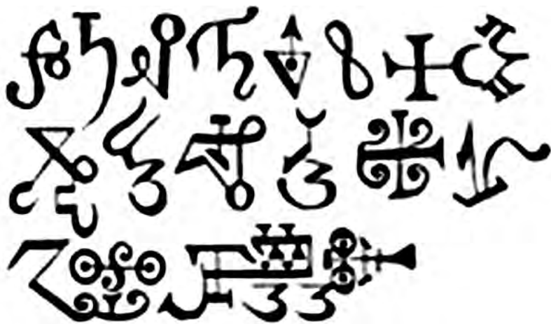
Магические знаки из Договора с Дьяволом

Таково традиционное определение чародея церкви. Насколько верно оно по части участия злых духов с точки зрения самих магов, то мы оставим на более позднее рассмотрение. Естественно, многие колдуны сами верят в своих бесов-по-